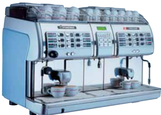
Mod. X3 PRESTIGE 2S/C