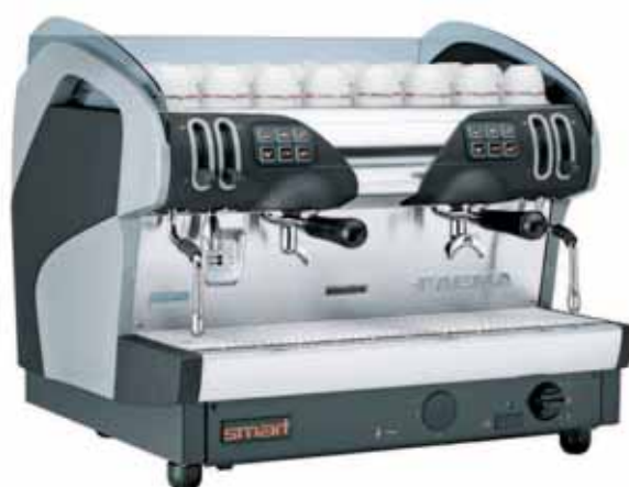
Mod. Smart Restyling A2