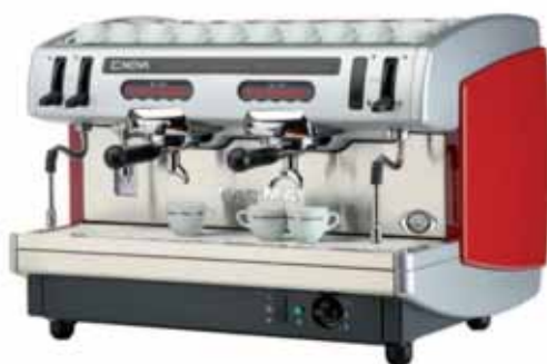
Mod. ENOVA S2