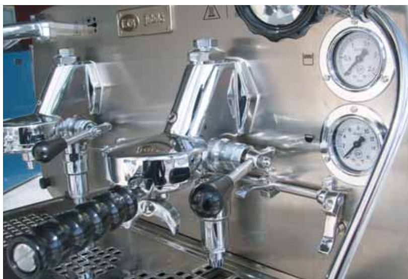
Mod. E 61 S2