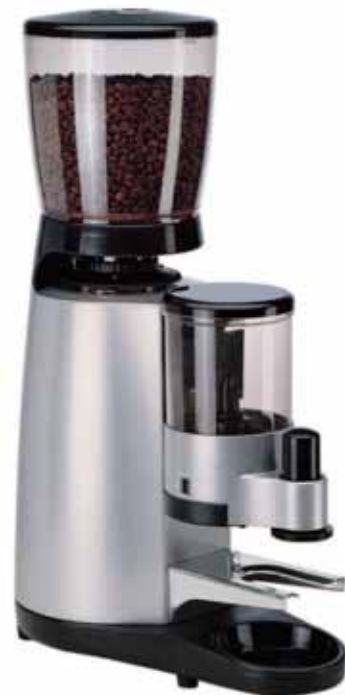
Mod. MD 3000