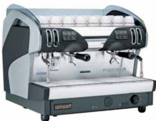
Mod. Smart Restyling A2