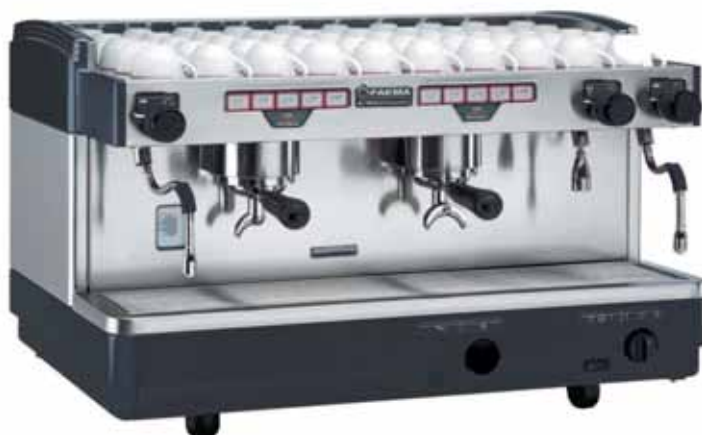
Mod. E 98 President A2