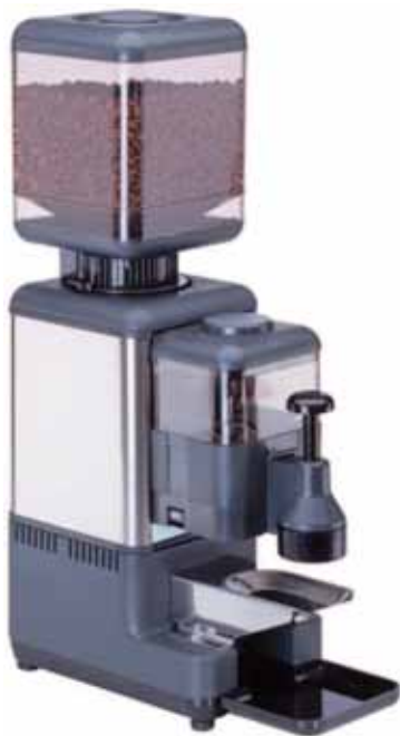
Mod. MPN A