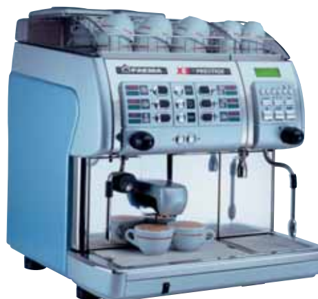
Mod. X3 PRESTIGE 1C