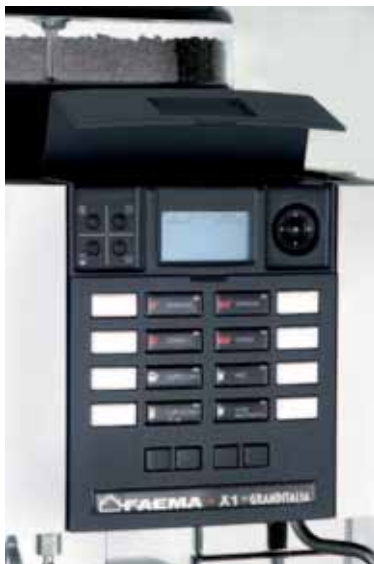
Mod. X1 GRANDITALIA