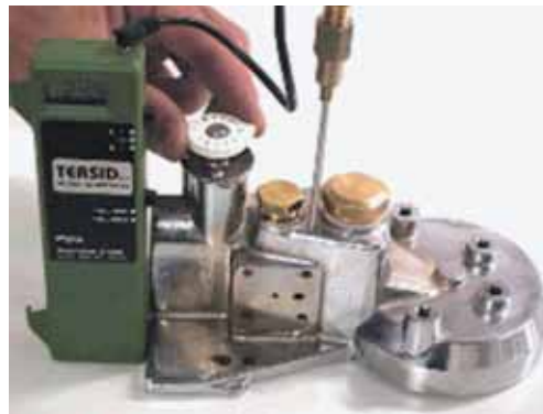
Sistema regulación térmica para E 91 AMBASSADOR S.E, E 92 ELITE