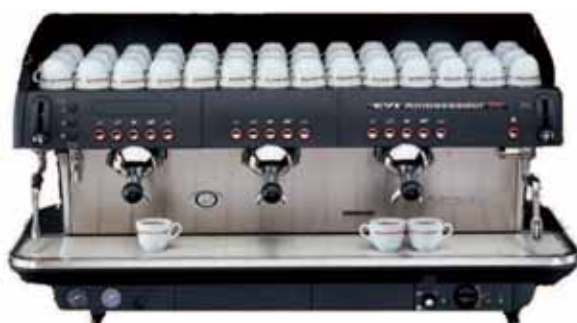
Mod. E 91 SE