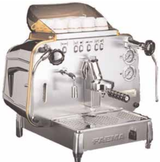
Mod. E 61 A1