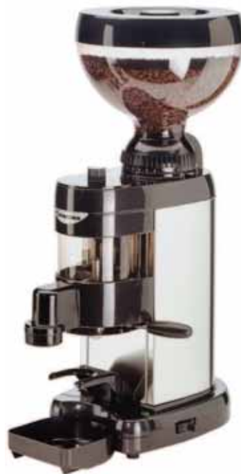
Mod. MC 99