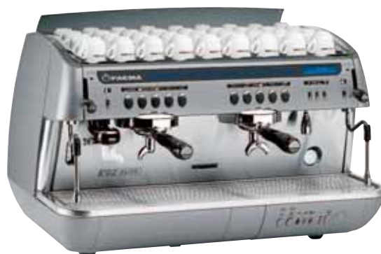
Mod. E 92 A2