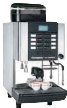
Mod. X1 GRANDITALIA