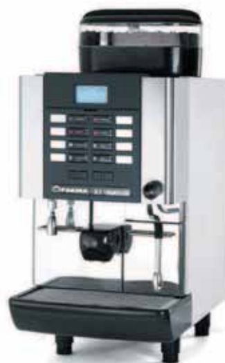
Mod. X1 GRANDITALIA