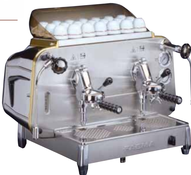
Mod. E 61 S2